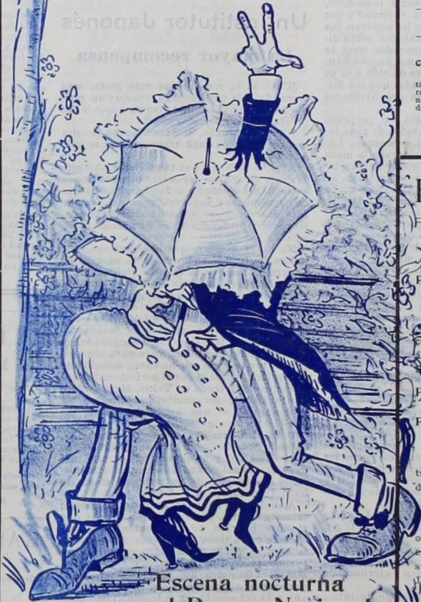
Escena nocturna en el Parque Nacional

ELLA. — Sí, pero la sombrilla ya la apartaste de mí.